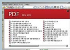
ePapyrus eForm Client 활용 예