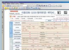
ePapyrus eForm Designer 활용 예